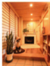
玄関に置かれたお風呂の扉と同じ素材、天井の照明もすべて同じ素材を使い、色調を統一しています