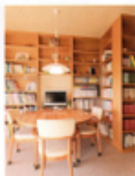
リビングで置かれたお風呂の扉も、お風呂の扉4枚すべて同じ素材を使い、色調を統一しています