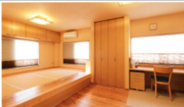
壁面や天井コーナーは段差をなくして下向き照明を配り、天井に照明器具を隠すことで明るく開放的な空間が実現