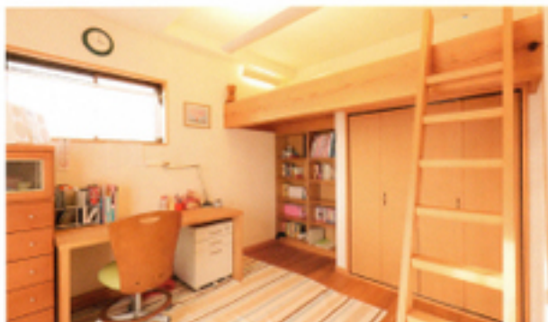
天井の段差が気にならないように「階段」は床材と同じ素材を使い、色調を統一しています